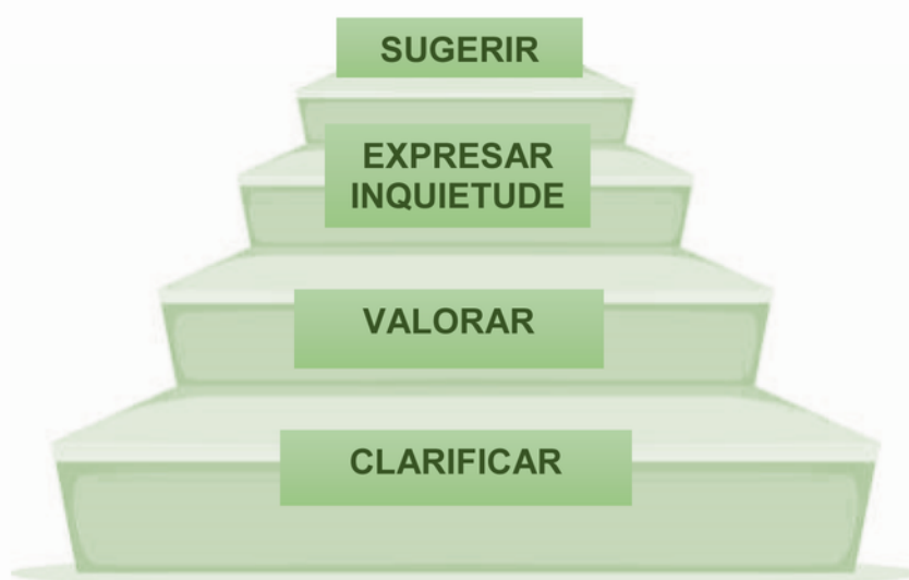
LA ESCALERA DE LA RETROALIMENTACIÓN DE DANIEL WILSON (2001)

*A partir de lo analizado, completar la Escalera de la Retroalimentación: